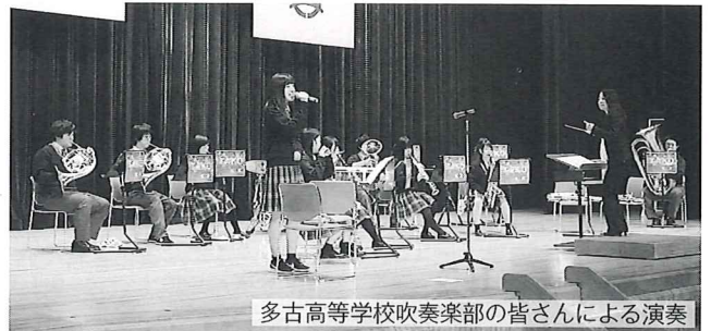
多古高等学校吹奏楽部の皆さんによる演奏

大会の席上、社会福祉の発展に寄与された10の個人、団体に対し表彰状を贈りました。