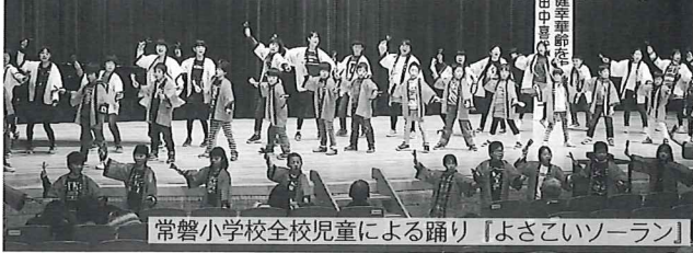
常磐小学校全校児童による踊り「よさこいソーラン」

福祉関係者が一同に会し、地域福祉の一層の充実を目指す第31回多古町社会福祉大会を3月3日、コミュニティプラザ文化ホールで開催しました。