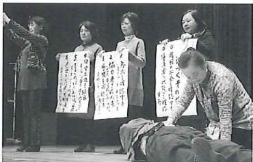
多古町防災ボランティアの皆さんによる寸劇

先生を講師に「スマートな生き方で健幸華齢を実現」と題し、健康で幸せに華やかに齢を重ねていくための生き方について講演いただきました。