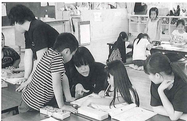
宿題を見てもらう子どもたち(多古学童)