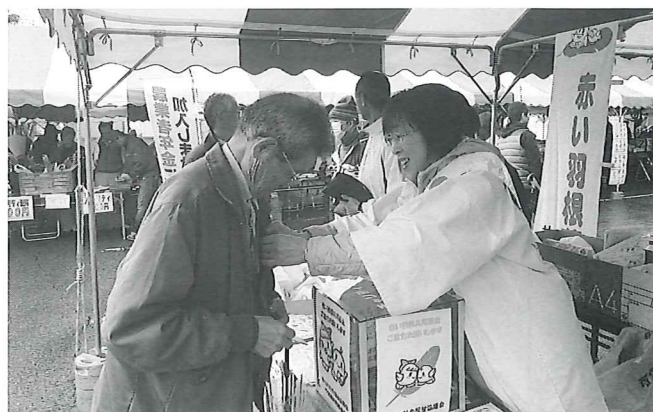
昨年の街頭募金活動