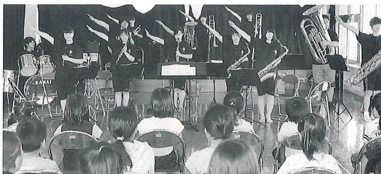
久賀学童での演奏