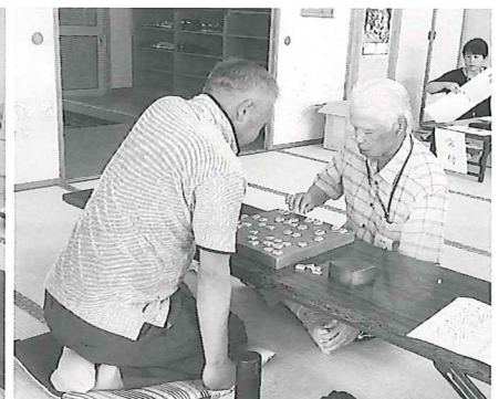
真剣な面持ちで対局していますが皆さんとても楽しんでます