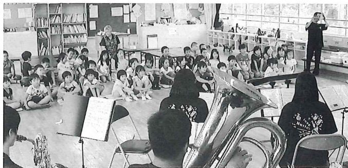
多古学童から演奏会がスタートしました

たり長縄跳びで遊んだり、また、夏休みの宿題を教えていただくなど普段にないふれあいや過ごし方に大喜びでした。