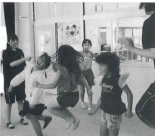
部員とのふれあい(久賀学童)