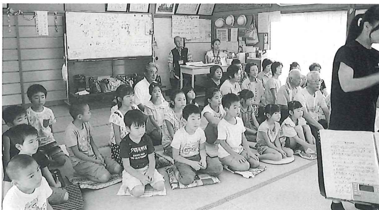
地域の方も聴きにきてくれました(常盤学童)