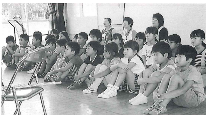
真剣に聴き入る中村学童の子どもたち