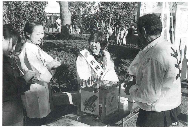
いきいきフェスタでの街頭募金