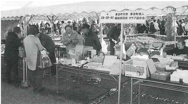
いきいきフェスタ・老人クラブバザー