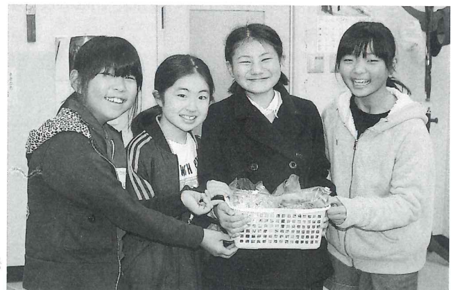
赤い羽根共同募金活動にご協力いただいた 中村小学校児童