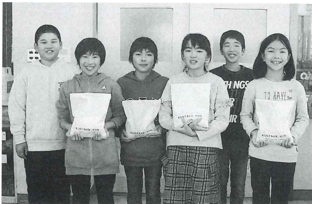
赤い羽根共同募金活動にご協力いただいた 多古第一小学校児童