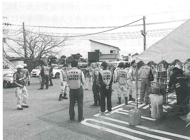
災害ボランティアセンターの運営