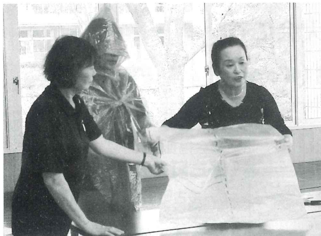
ボランティアの集いでの意見交換、研修会

「共に助け合い、生きがいとやすらぎのあるまちを」の願いをこめた地域ぐるみ福祉を重点に、各種施策を推進していきます。