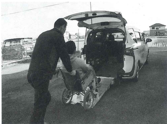
外出支援サービスは歩行困難な方の外出を支援します