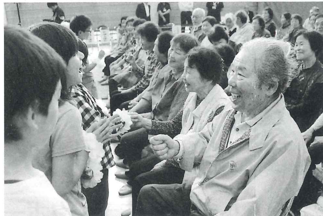
地域での世代間交流