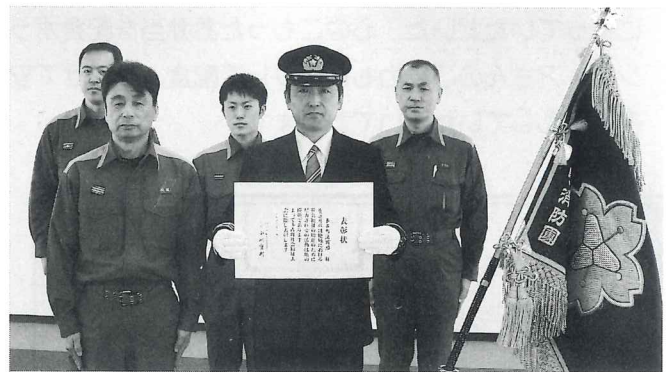
多古町消防団・多古分署