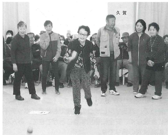
高齢者の生きがいづくり