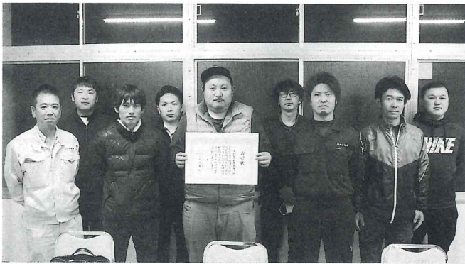
多古町商工会 青年部