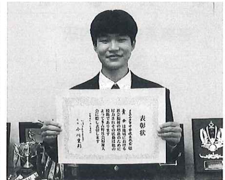
多古中学校生徒会