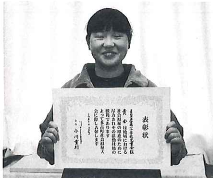
多古第一小学校児童会