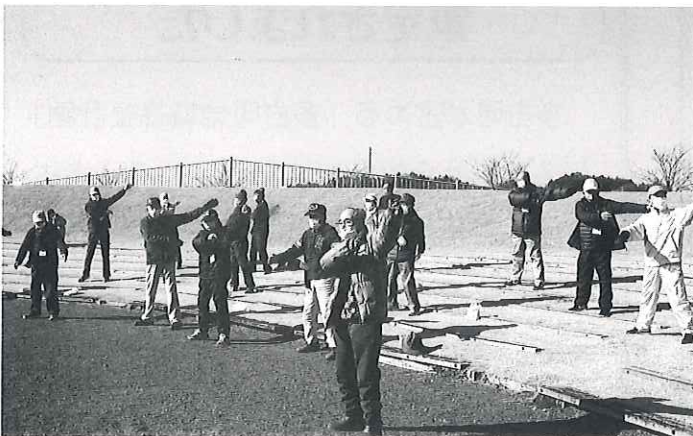
歩く前に準備体操！

次回の開催も予定しておりますので、ぜひ会員のみなさんはふるってご参加をおまちしています。