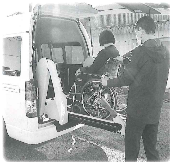
▲外出支援サービス