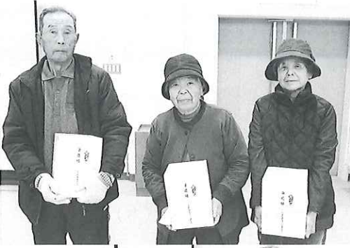
◀ 準優勝：南玉造チーム