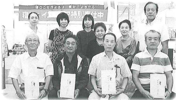
▲敬老行事などの地域福祉に使われます。