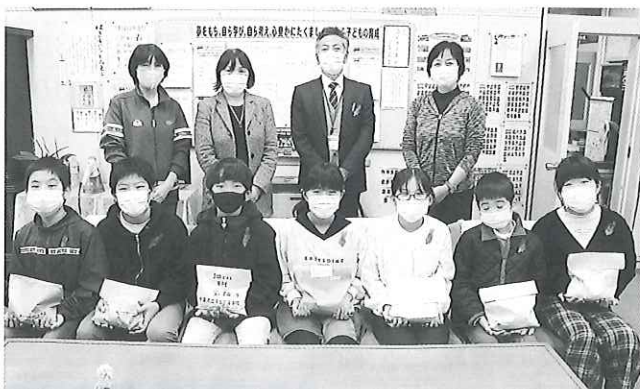
▲多古第一小学校児童