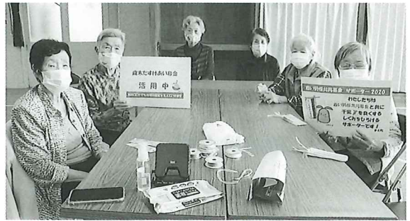
ミニデイサービス久賀地区(令和2年度)

あなたの募金があなたのまちのどこに役立てられているか、配分事業についてホームページでご覧いただけます。