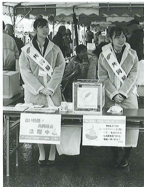
いきいきフェスタ街頭募金(令和元年度)