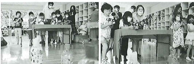
射的をする子供たち よ〜く狙って!

多古高生たちによるレクリエーションや、スノードーム作り、フォトフレーム作りなど行い、学童保育所に通う児童たちはとても喜んで参加していました。