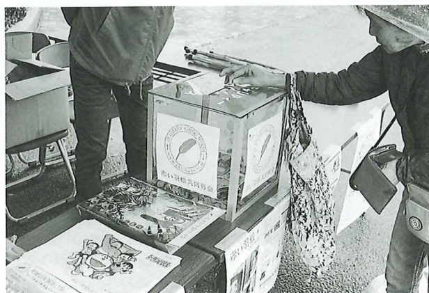
いきいきフェスタ街頭募金