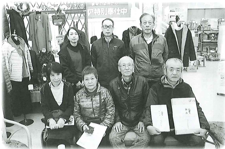
▲敬老行事などの地域福祉に使われます。