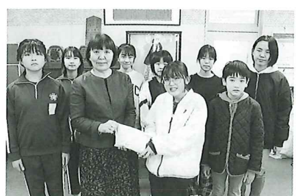
多古第一小学校児童