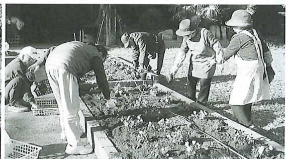
桜木老人クラブのみなさん