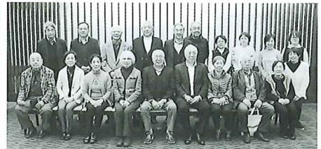
第二地区社協の皆さん