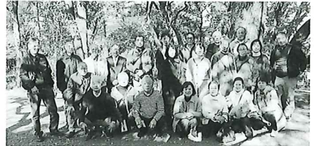
中地区社協の皆さん