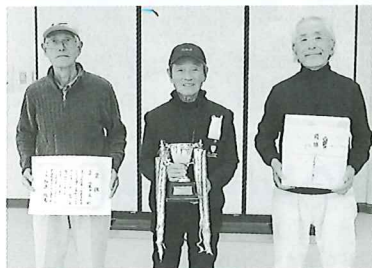
優勝：桧木チーム 準優勝：染井Bチーム 第三位：次浦Aチーム