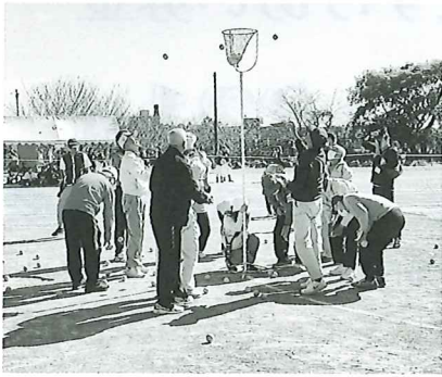
老人クラブは紅白2チームに分かれて玉入れに参加しました。