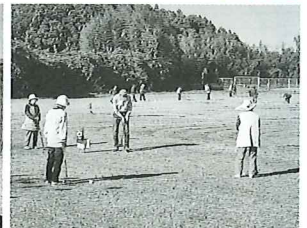
チャリティグラウンドゴルフ大会の参加費を歳末たすけあい募金にご寄付いただきました。