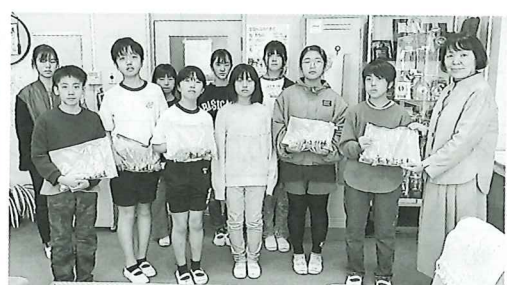
多古第一小学校児童