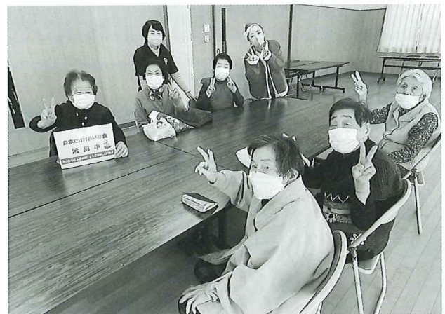
ふれあい交流クラブ