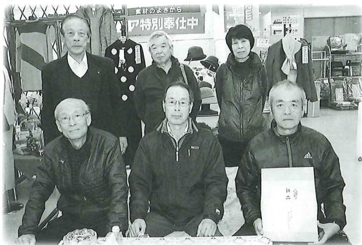
▲敬老行事などの地域福祉に使われます。