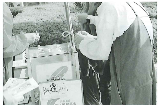
いきいきフェスタ街頭募金