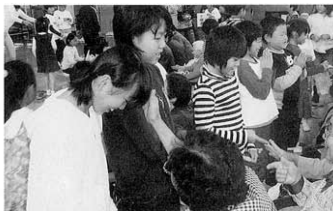
会場は笑顔でいっぱい