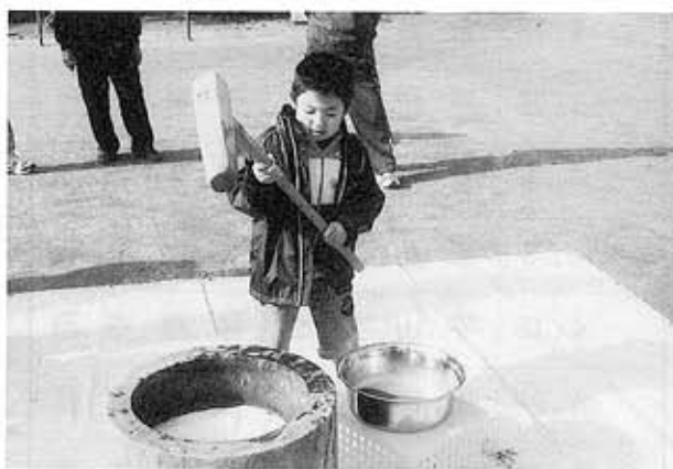
けっこう重たいぞ…