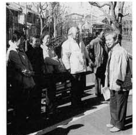
第一地区社協の小江戸めぐり