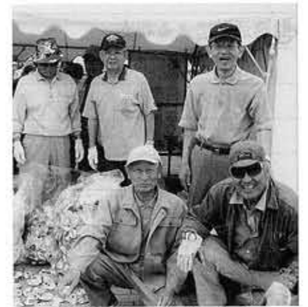
会員によって集められたアルミ缶が車椅子に

は施設整備補助金などで、支出は施設整備などに係る支出です。 ③財務活動による収支の部は、収入は積立預金取り崩し収入、支出は積立金支出などです。繰越金は当期末支払資金残高で表示しています。