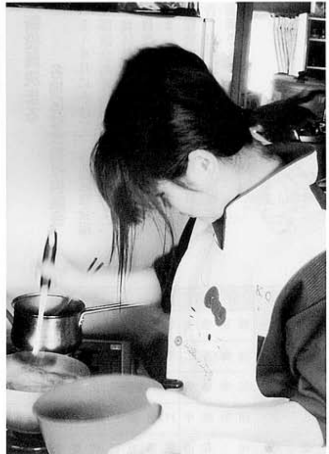
中学生の料理の手伝い体験 アクを取って、よりおいしくなりますように。