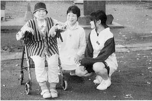
利用者さんとの散歩途中のひと時

「この経験を活かし、これからは人との係りをもっと大切にしていきたい」と感想を語ってくれました。