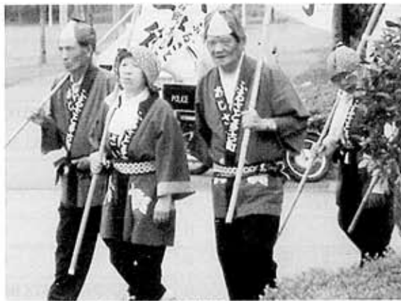
なかなかお似合いの面々