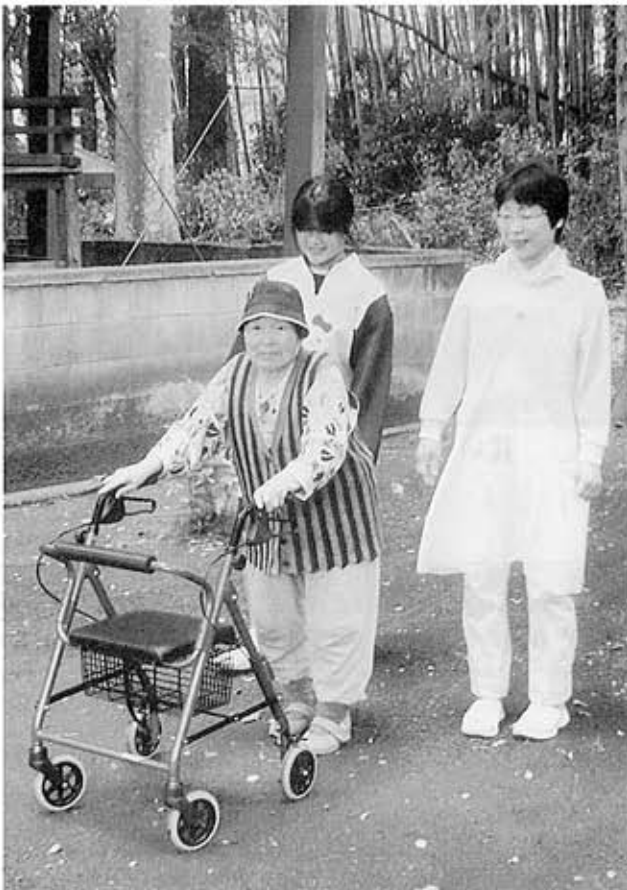
「外に出ると気分もリフレッシュします。」と利用者さんも楽しそうでした。