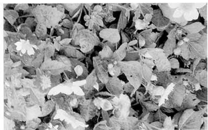
花いっぱい運動のダリア

総会では、20年度の決算・事業報告、21年度の予算・事業計画などが審議されました。