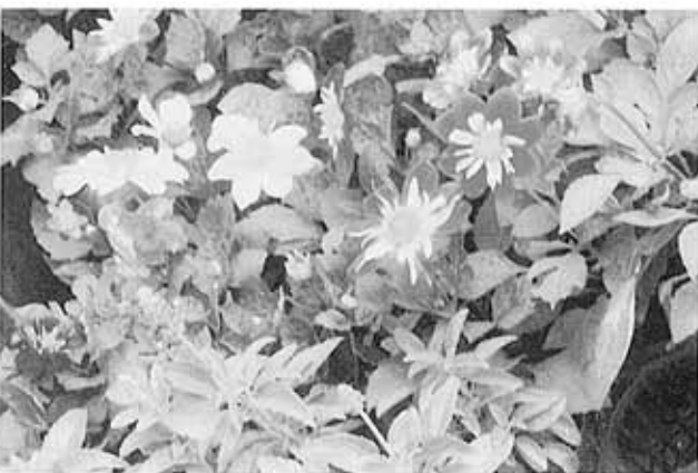
ブルーサルビア・ダリア