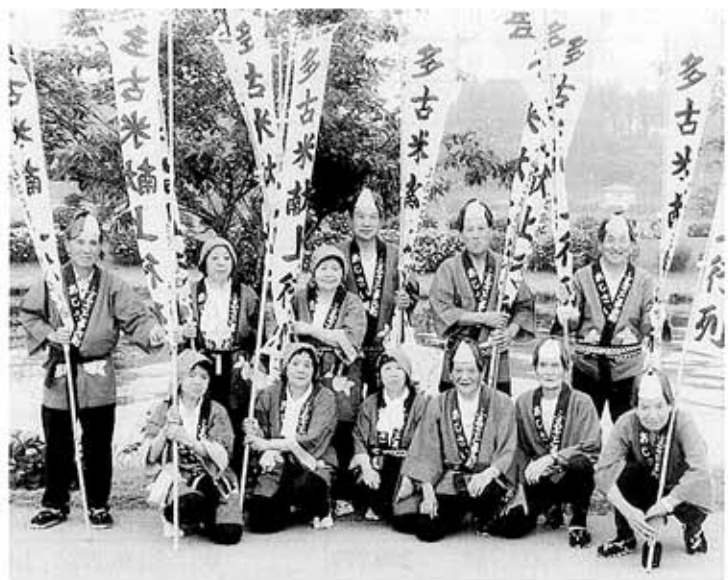
老人クラブのあじさい祭りでの献上行列