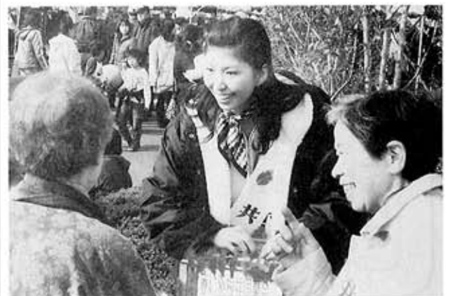
昨年のいきいきフェスタで