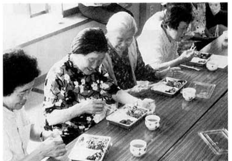
手づくり弁当に舌鼓を打つ参加者

その後、クエン酸で疲労回復にとさっぱり梅ご飯、スキムミルクや生姜や木綿豆腐が入って栄養満点のえのき和風ハンバーグ、夏野菜の煮物や和え物など町の保健推進員の皆さんによる手づくり弁当に、舌鼓を打ちながら楽しいひと時を過ごしていました。