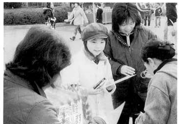
募金と一緒にさわやかな笑顔も