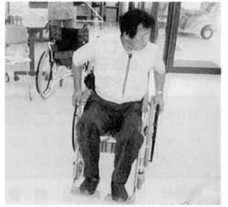
切りかえしもなかなか大変