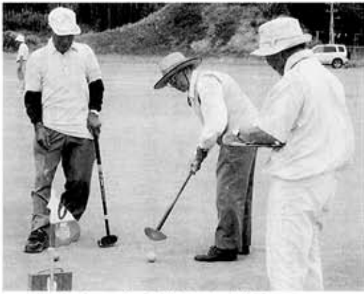
ねらいをさだめて、慎重に!!

競技はグラウンドゴルフ、ゲートボールの2種目です。成績上位のグラウンドゴルフ36名が香取地区スポーツ大会へ参加します。