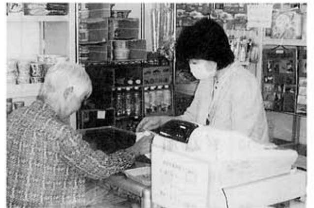
インフルエンザ予防のためマスクを着用