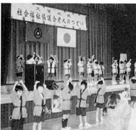
昨年の久賀地区老人のつどい