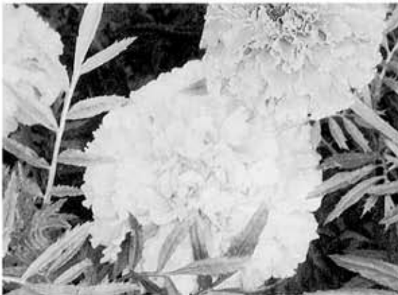
大輪のマリーゴールド