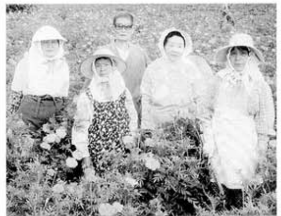
手をかけた花畑の中で