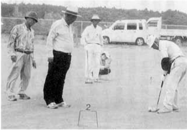
みんなが見つめる中での一打