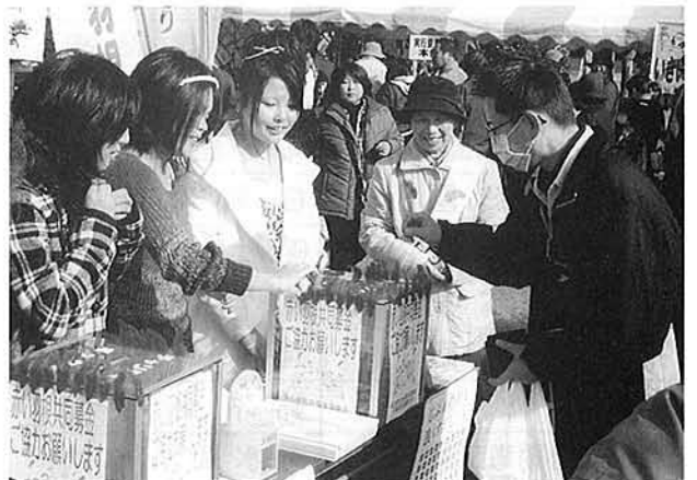
華やぐキャンペーン会場