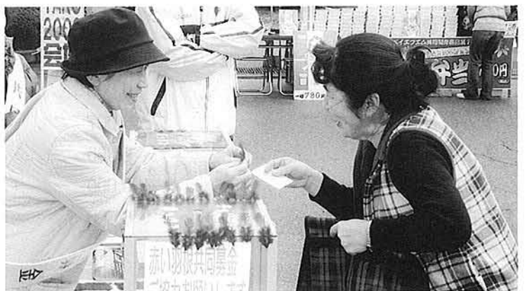
寒い外でも、気持ちはあたたか