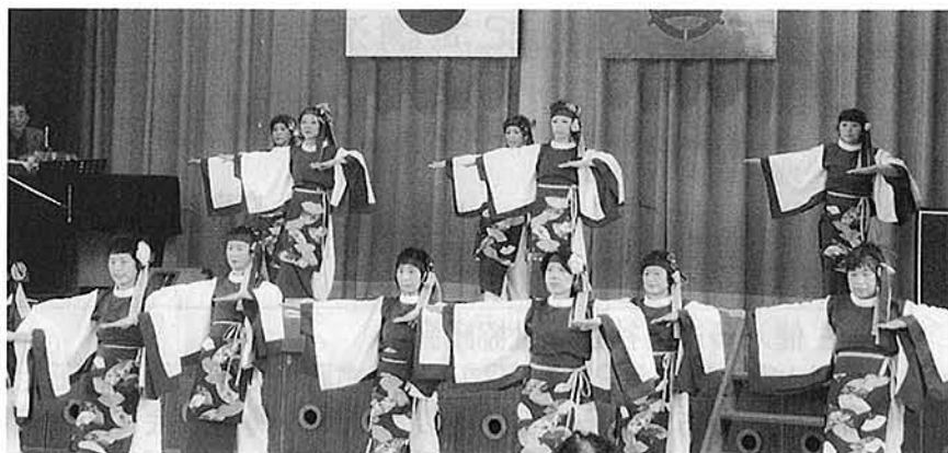
中地区 ピュアダンス研究会のダンス