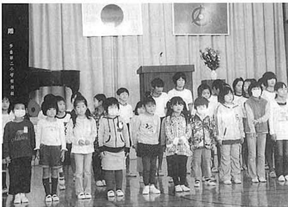
第2地区 第二小生徒

最後におろちの会のコーラス、会場に響くすばらしい男性の合唱がラストを飾りました。