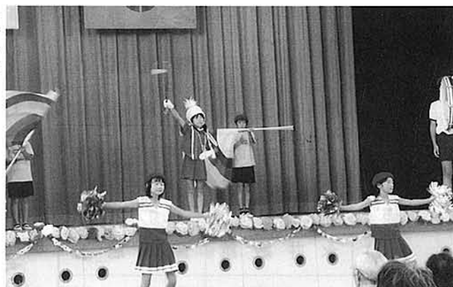
常磐地区 チアダンス