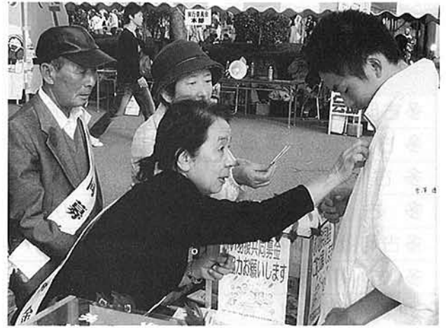
赤い羽根にまごころを添えて