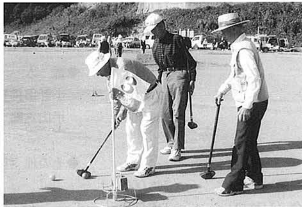
みなさん 真剣です