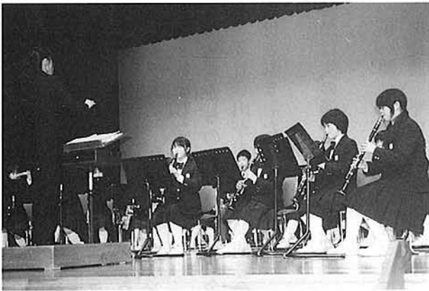
第1地区 多古中学校のブラスバンド演奏