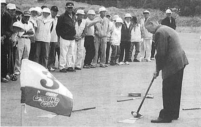
勝又会長のショット