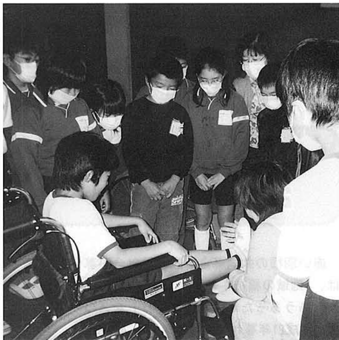
11月13日 中村小生徒による車椅子体験学習