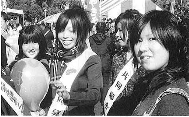
多古高生 キャンペーンガールに!!