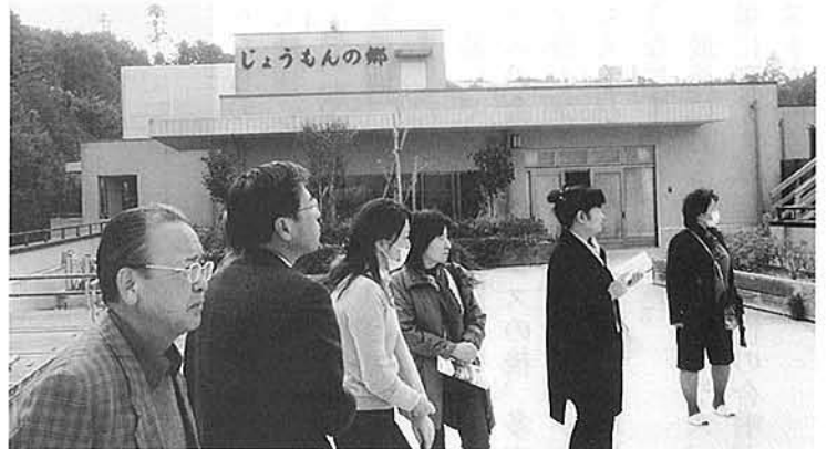
11月7日 常磐地区社協、神崎町福祉施設を視察