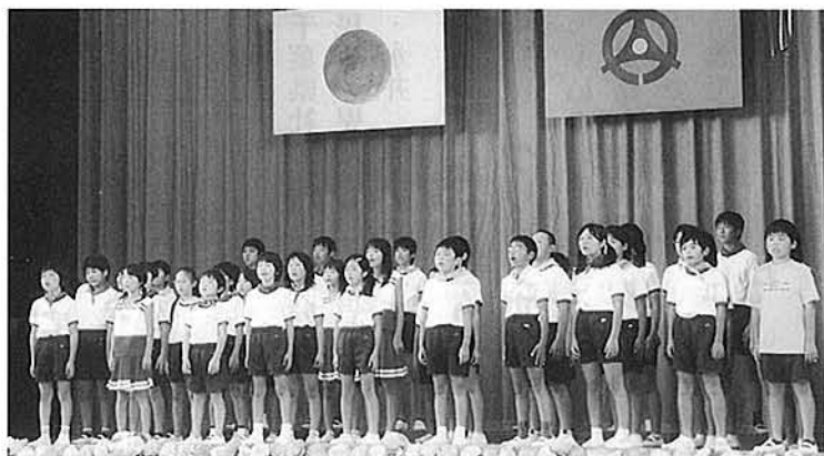
常磐地区 常磐小生徒による合唱

地区の皆さんによる舞踊やカラオケ、ハーモニカによる演奏、途中昼食をとりながらのおしゃべりなど、参加者の中には「こういった行事に参加することが出来て、とても楽し