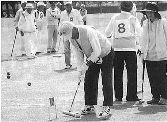
みんなが見つめる中での一打

各老人クラブから愛好者2000人が参加し、日頃の練習の成果を十分に発揮しました。