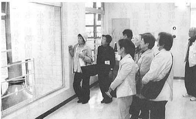
11月11日 中地区社協、茨城ビール工場を視察