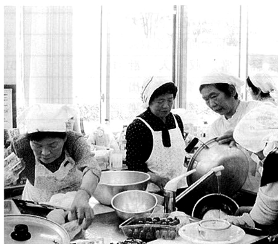
老人クラブ会員による食事サービス調理光景

支出の主な事業としては、食事サービス、ひとり暮らし高齢者ふれあい訪問、外出支援サービス、地区社会福祉協議会等活動運営補助、各種団体助成、ボランティア活動助成、共同募金活動、ホームヘルプ事業、日常生活用具の貸出し、ねたきり身障者、母子家庭等の援助、歳末助けあい活動などです。 収益事業は、国保多古中央病院内の売店事業、公益事業は居宅介護支援事業(ケアマネージャーによるケアプラン作成等)などを行っています。