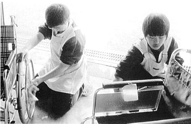
車イスを掃除する中学生

いに洗車し、いよいよヘルパーの指導のもと利用者さん宅へ。挨拶の後、部屋の掃除、台所に入って料理の手伝い。