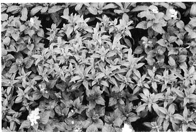
満開が楽しみな4種の花苗

会員の優しさがたくさん詰まった花が、大勢の方々の目に止まることで心が豊かな町づくりをめざします。