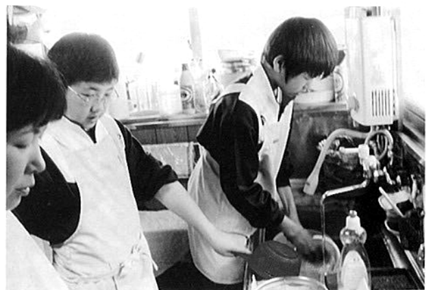
利用者さん宅で料理の手伝い