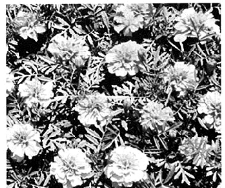
多古高生が種から育てた マリーゴールド (詳細は7ページ)