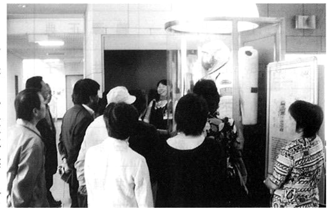
宇宙服の説明に耳を傾ける

ーメンやねぎま、最近考案されたもんじゃ焼きなどを見た後、宇宙飛行士が実験等を行う大型バスと同じ位の大きさの船内実験室「きぼう」の模型に入り、無重力の説明や船内での作業の様子などの説明を受けた。