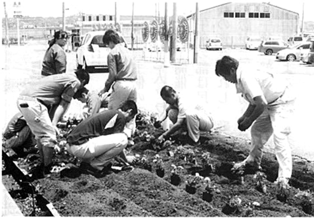
配置を考慮しての苗の植えつけ

県の景観条例・アダプトプログラムにより毎年2回、多古高の生産流通科の生徒が4月に種をまいて育てた約千本のマリーゴールドの苗を植えて花いっぱいにし、通行する人た