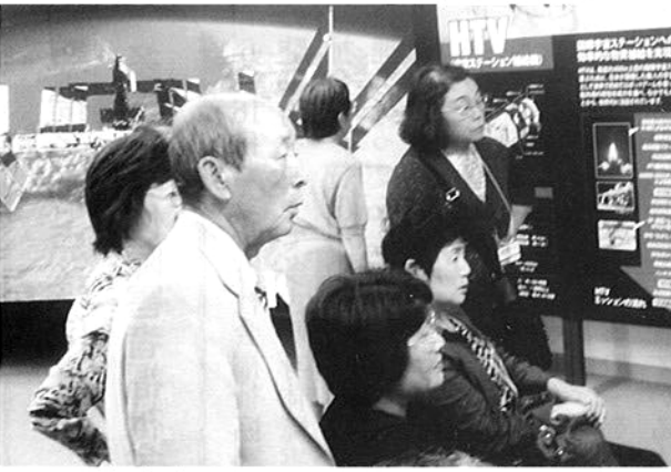
国際宇宙ステーションのパネルの前で

センター内は、東京ドーム約12個分の広さがあるため、次の見学場所の展示施設への移動はバスで向かう。1975年に打ち上げられたロケットの模型や最新式のロケットエンジン、宇宙食のコーナーでは宇宙ラ