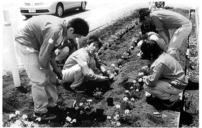
マリーゴールドを植える多古高生