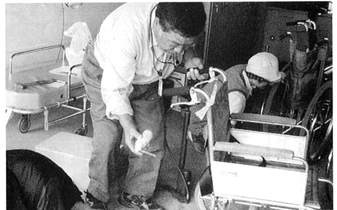
梅雨対策に油を差す