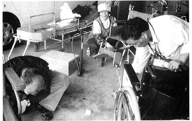
掃除・点検に余念のない会員

「自分たちが、心を込め手をかけた車椅子が、必要とされている人たちに気持ちよく使ってもらいたいです。」