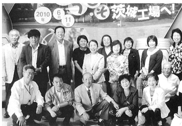
ビール工場内にて