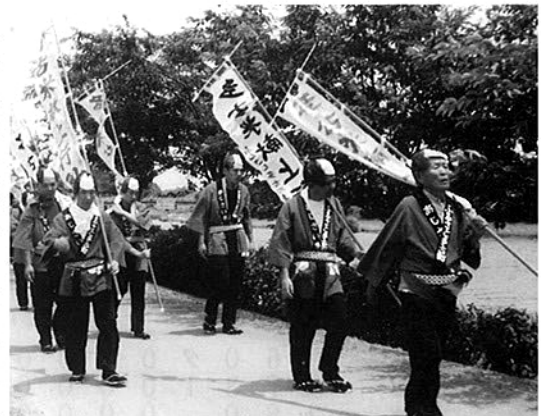
川風に吹かれ多古米献上行列

6月13日、多古町老人クラブ連合会会員12名が、今年で26回目のあじさい祭りに参加しました。