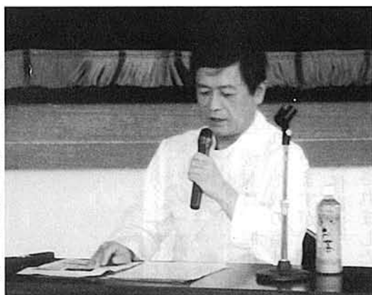
石橋先生の健康講話

中地区社会福祉協議会では、地区の皆さんの健康づくりの手助けになればと、毎年地元医師に協力いただき「健康」をテーマとした講演会を開いています。