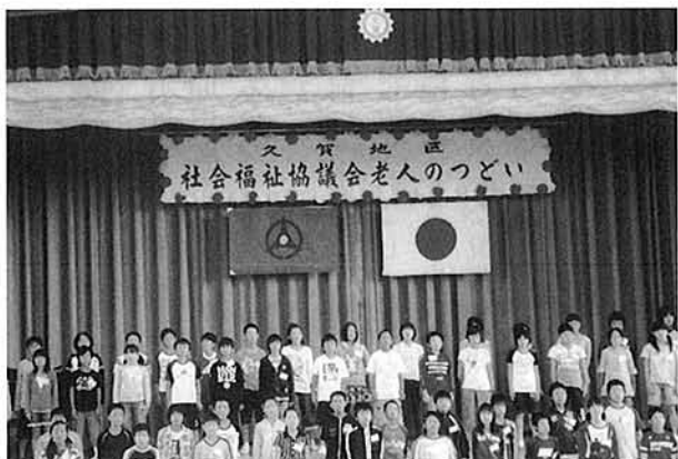
久賀小児童による合唱（久賀地区）

本年度の多古町の70歳以上の高齢者は3,828人。各地区の敬老対象者は多古第一地区1,058人、