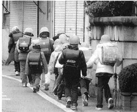
上級生と一緒に下校する新1年生

社会福祉協議会では、町の関係部署と協議し、諸事情を考慮の上善意を活かしていきたいと思ひます。