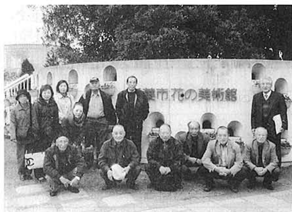
千葉市花の美術館で