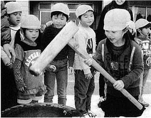
慣れない餅つきに歓声も