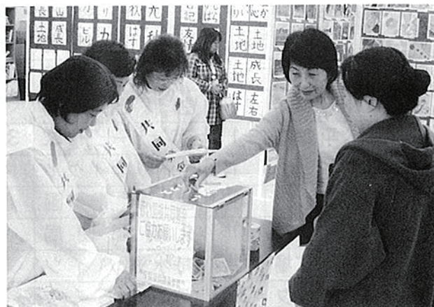
日赤奉仕団による募金活動