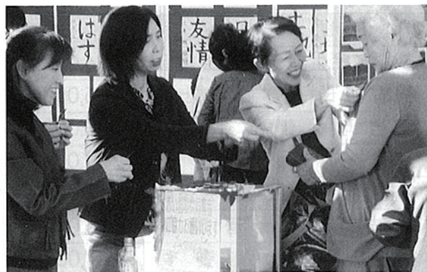
文化祭でのナンシー会による募金活動