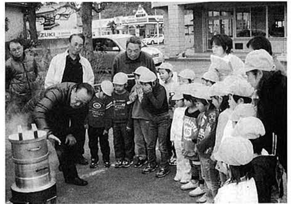
餅米ふかしに見入る園児たち