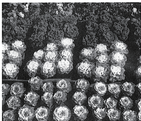
町を暖かく彩る3種の花苗

多古町老人クラブ連合会では、毎年9月18日の社会奉仕の日を中心に、各クラブごとに地域の集会所・公園・道路・神社の清掃や草刈・花の手入れを行なっています。