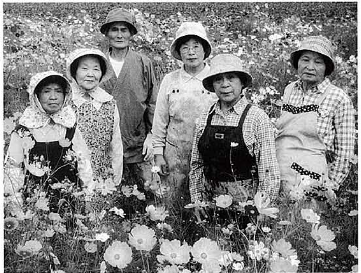
10月13日 宮本シニアクラブ会員によるコスモス植栽