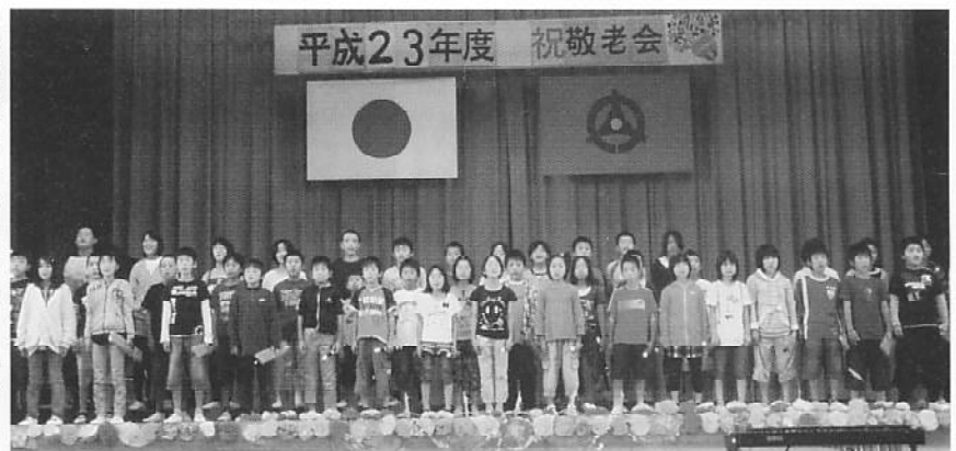
「常磐地区敬老会」常磐小児童による合唱（昨年）

敬老会行事を行っています。 町内在住でことしの12月末で70歳以上とされる方を対象に、それぞれ招待しています。