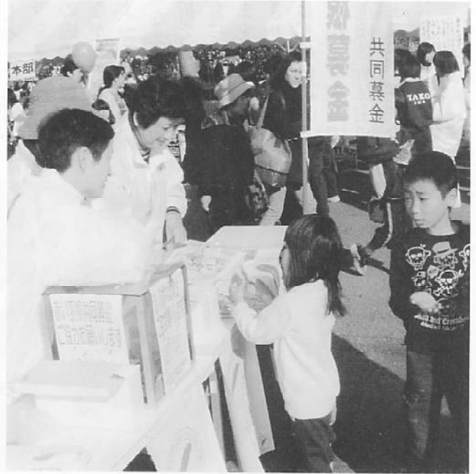
赤い羽根を受け取る女の子