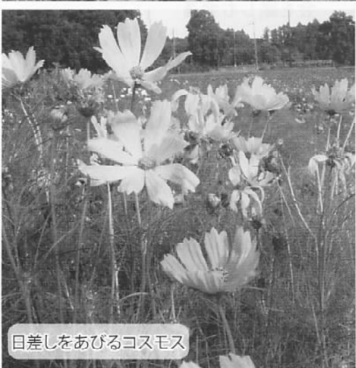
日差しをあびるコスモス