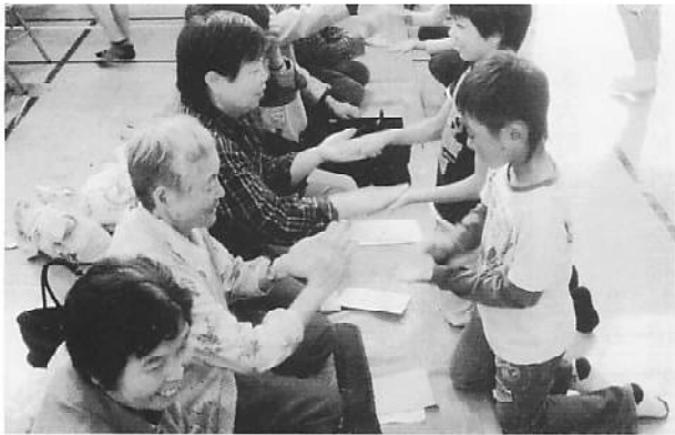
「中地区敬老会」中村小学校 高齢者と児童とのふれあい（昨年）