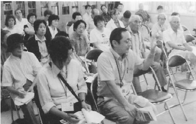
箱崎先生へ質問をする参加者

寝たきりの人の5人に1人は、転倒による骨折が原因で、家庭で転倒の危険箇所は主に階段、お風呂、居間など特に注意が必要です。