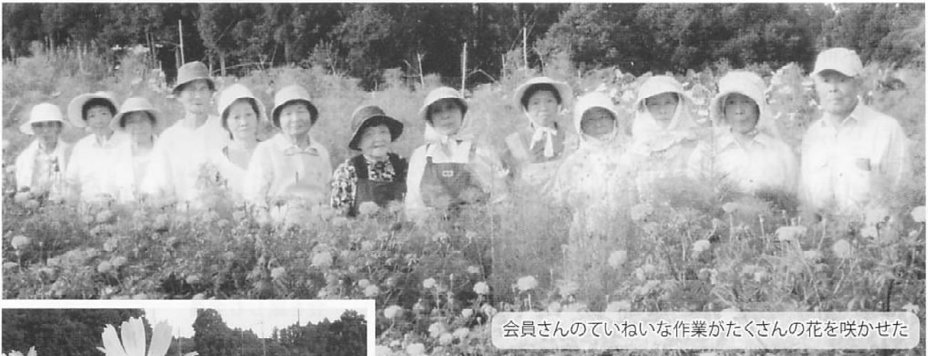
会員さんののていねいな作業がたくさんの花を咲かせた