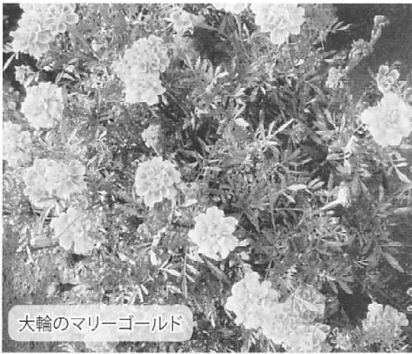
大輪のマリーゴールド