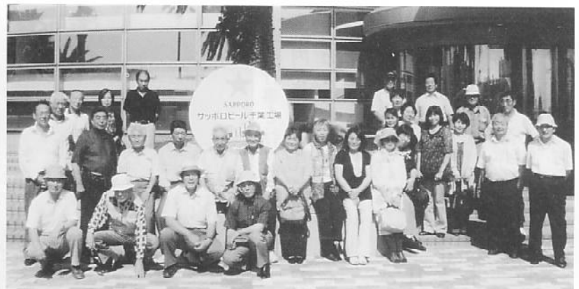
船橋ビール工場にて