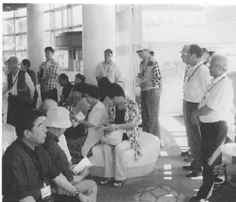
見学前にロビーでくつろぐ一行