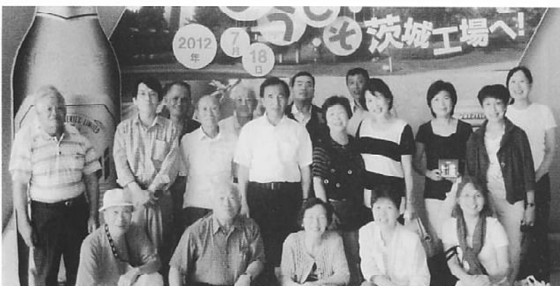
ビール工場のロビーにて

宇宙服は、背中に酸素やバッテリーなどの生命維持装置がついていて最長で8時間活動できること。ほかには宇宙食など興味深い説明を受けました。 次の視察場所のビール工場では、ビデオによる工場案内の後、ビールができるまで、びんや缶詰め工程を見学。 地上60mの試飲会場タワービルでは関東平野を一望、できたての生ビールを味わった一行でした。